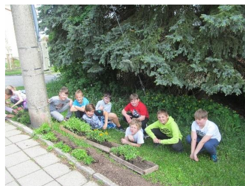
Fotografie z Učíme se venku – péče o květinový záhon