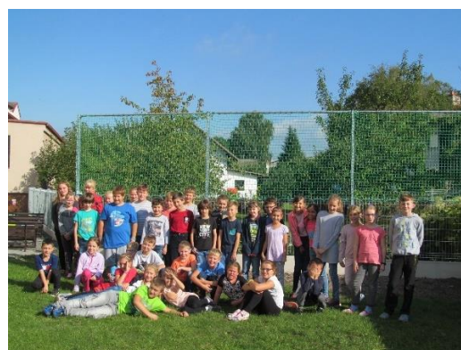
Nový plot za školou