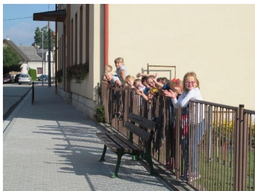
Nový chodník před školou

Touto cestou děkujeme zřizovateli i rodičům za školní svět plný klidu a pohody.